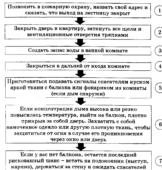
Схема 5. Действия в случае, если нет возможности покинуть квартиру при пожаре в доме